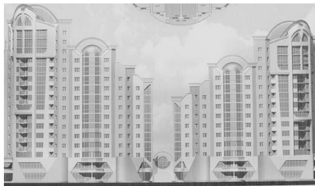
Микрорайон «Университетский» Жилой дом с социальным типом №1